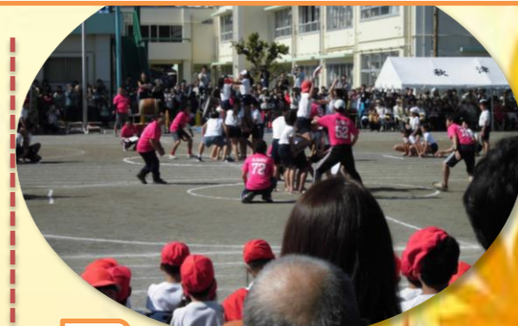
芸能文化祭に行きました