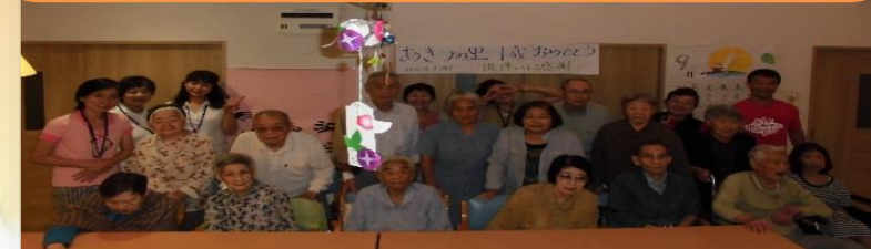
秋津小の運動会を応援に伺いました！

あきつの里は、昨年に関所し、9月に 1周年 を迎えました！ 利用者さまを始め、地域の皆様にも憩いの場となるような温かい場所を目指していきたくと思います。今後もあきつの里をよろしくお願いたします！