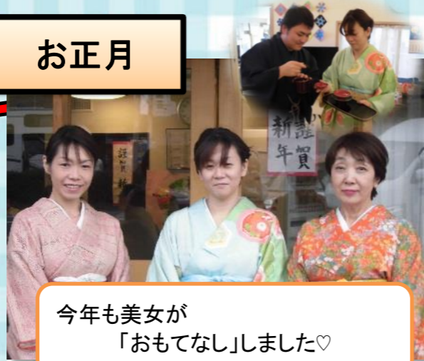
今年も美女が「おもてなし」しました♡