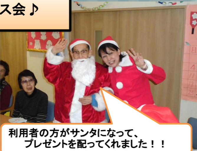
利用者の方がサンタになって、プレゼントを配ってくれました！！