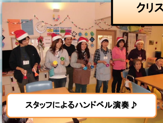
スタッフによるハンドベル演奏♪