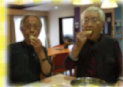
たまにはつまみ食いw