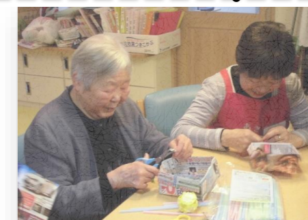
赤いエプロンでお馴染み 秋津福祉協力員さん

地域の方や秋津福祉協力員の方々にボランティアに来て頂いています。利用者の話し相手、演奏やダンスの披露など、みなさんの得意分野でご活躍されており、あきつの里にとって大切な存在となっています。