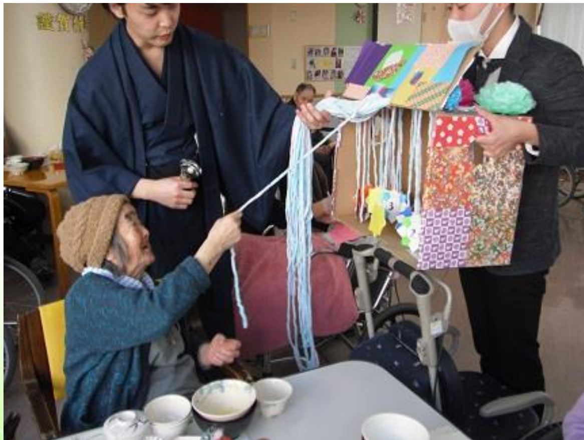
毎年恒例の福引を各フロアで行いました。