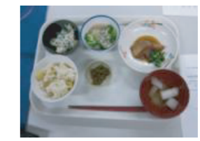
※栗ご飯・金目鯛の煮付け ブロッコリーの蟹あんかけ 白和え・清汁

同じ献立の「濃厚食」なども試食していただき、食感や味の違いなども実感していただきました。次回も皆さまのご参加をお待ちしております。