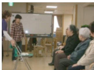
イスの上に上手に乗せられるかな?

八国苑で毎朝繰り返される風景です。 皆さんの元気なお姿に職員はいつも圧倒されています。