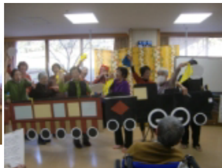
汽車に乗って、高原列車を唄いながら黄色いハンカチを振りました♪