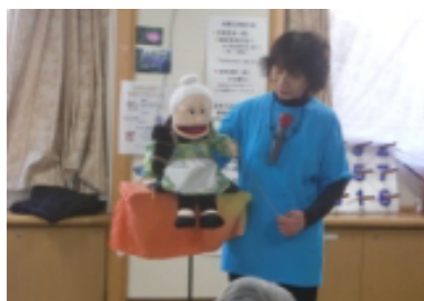
お人形「ふじこちゃん」の 腹話術もお見事！

「南京・玉すだれ」！！「ふじみ玉すだれ一座」の方たち による、南京玉すだれ！ (3月2日)