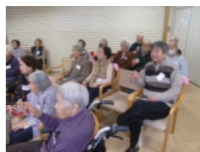
皆様の鈴と太鼓の 演奏で盛り上がり ました♪