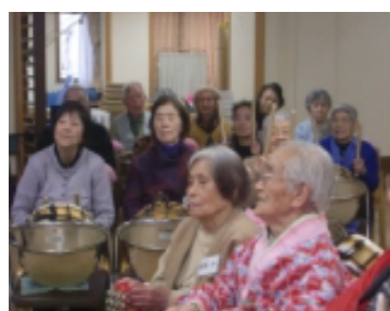
素敵なお内裏様と お雛様ですね♪