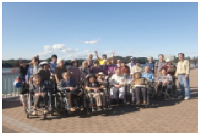
写真は過去のご様子です!

○ 「秋の外出ドライブ」のお知らせ ○ 日にち…十月十六日(金)・十九日(月) ○ 時間…午後 ○ 場所…未定♪