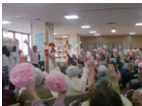
春の野外音楽セラピー

※どちらも雨天時は、屋内の活動に変更させて頂きます。 臨時参加ご希望の方は職員までお申し付け下さい。