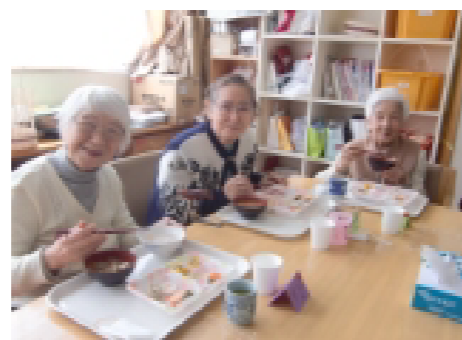
春のガーデンパーティー