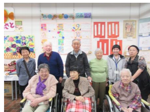
写真は昨年の様子です！