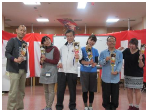
写真は前回の様子です！