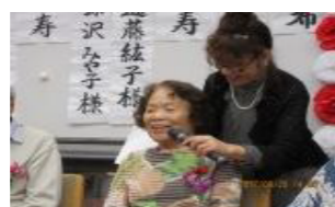
写真は昨年の様子です！