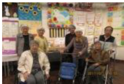
写真は昨年の様子です！

今年の八月は記録尽くめの夏でした。戦後で一番暑いと発表がありました。翌日には気象庁が、統計を開始した明治三十一年以降なんと百三十一一年間で一番暑い夏だったと訂正がありました。台風も次々と発生し西日本だけでなく日本中のいたる所で豪雨災害が頻発しています。北海道でも大きな地震がありました。文明がこれだけ進んでも気象災害には慄くばかりです。旬の味覚を楽しめる穏やかな秋を望みます。