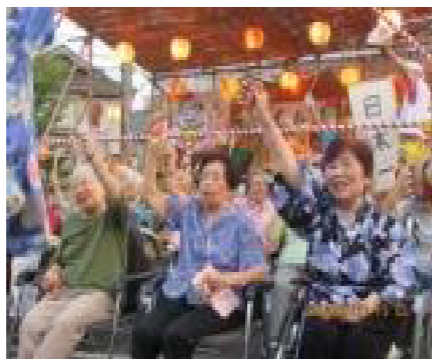
写真は昨年の様子です！