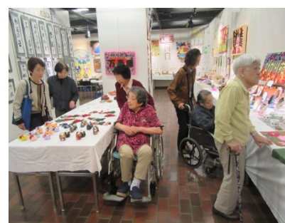
写真は昨年の様子です！