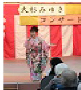
大杉みゆきショー♪