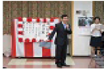
あおばバーバース♪